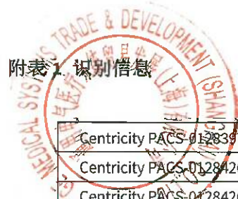
附表 1. 识别借息